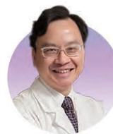
盧煜明教授 香港科學院; 香港中文大學