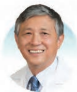
許家傑教授 美國加州大學洛杉磯分校 東西醫學中心