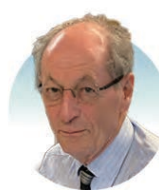
Michael Marmot爵士教授 倫敦大學學院