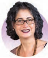
Beverley Vollenhoven 教授 澳洲蒙納殊大學; 澳洲蒙納殊健康中心; Monash IVF